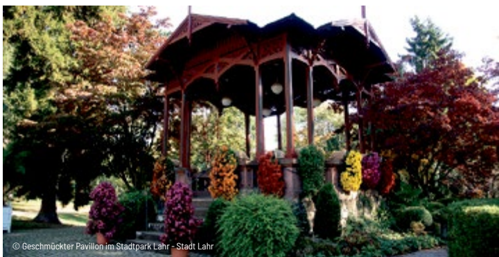
Geschmückter Pavillon im Stadtpark Lahr