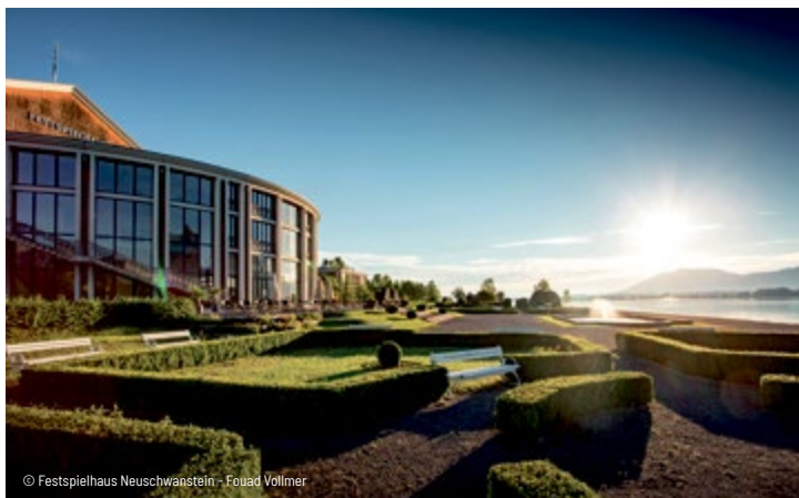
© Festspielhaus Neuschwanstein - Fouad Vollmer