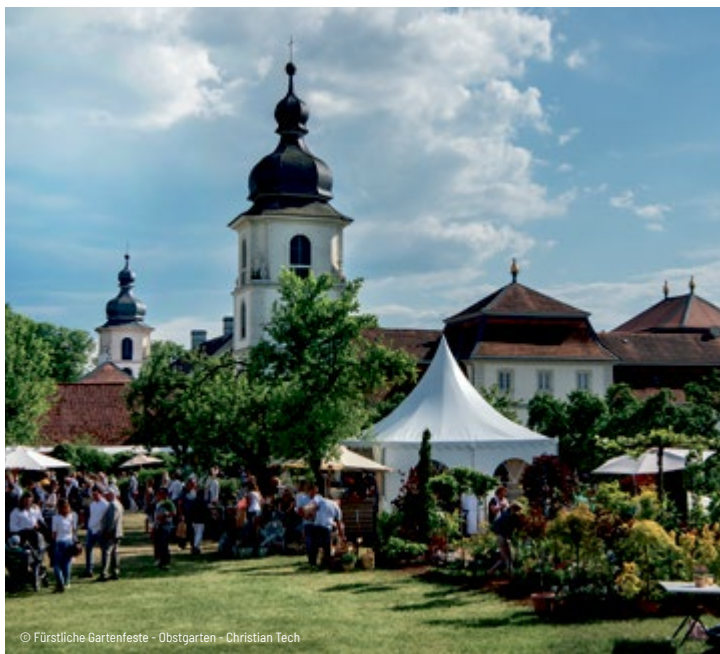
Fürstliche Gartenfeste – Obstgarten